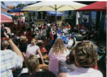
Viele Zuschauer bei der Aufführung der Kinder