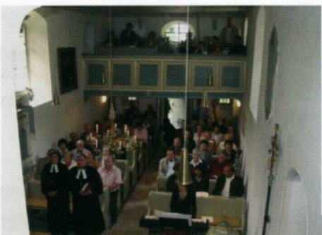
Gottesdienst 100 Jahre Kirchenjubiläum