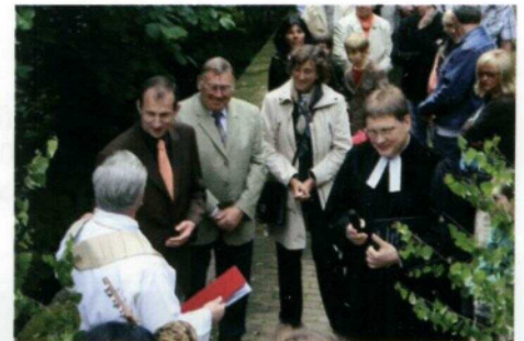
Einweihung dem neuen Kirchentreppe