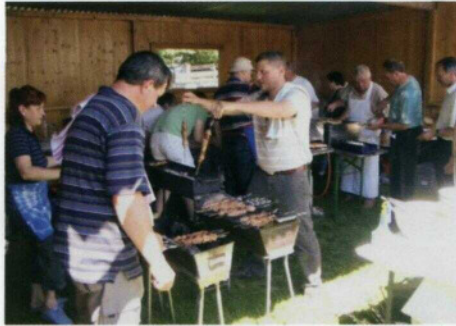
Optimale Zusammenarbeit in der Küche