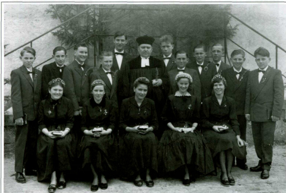
Gruppenbild Konfirmation 1958 in Mönchsroth