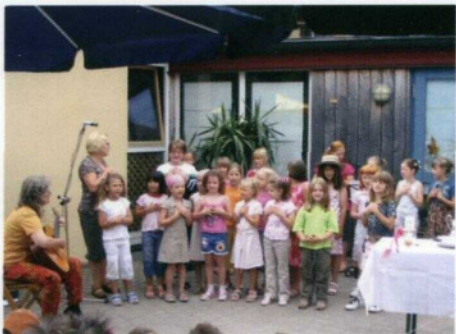
Der erste Auftritt des Kinderchores beim Kindergartenfest