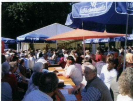
Alle Bänke waren besetzt