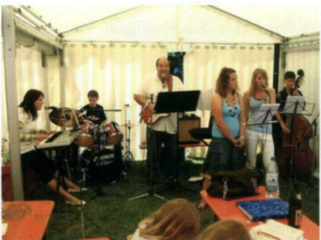
Auftritt der Jugendband unter Leitung von UM Rudolf