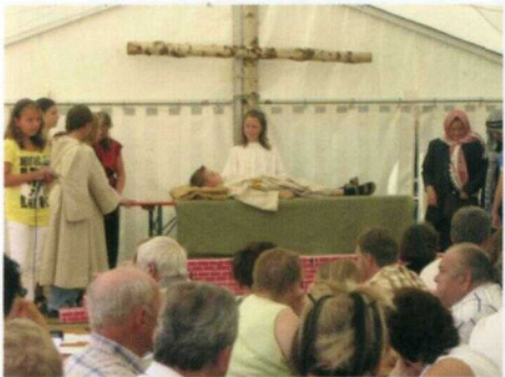
Anspiel: Die Heilung des Gelähmten