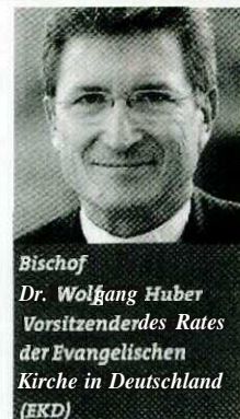
Bischof Dr. Wolfgang Huber Vorsitzender des Rates der Evangelischen Kirche in Deutschland (EKD)

Was bei den Menschen unmöglich ist, das ist bei Gott möglich. Lukas 18,27