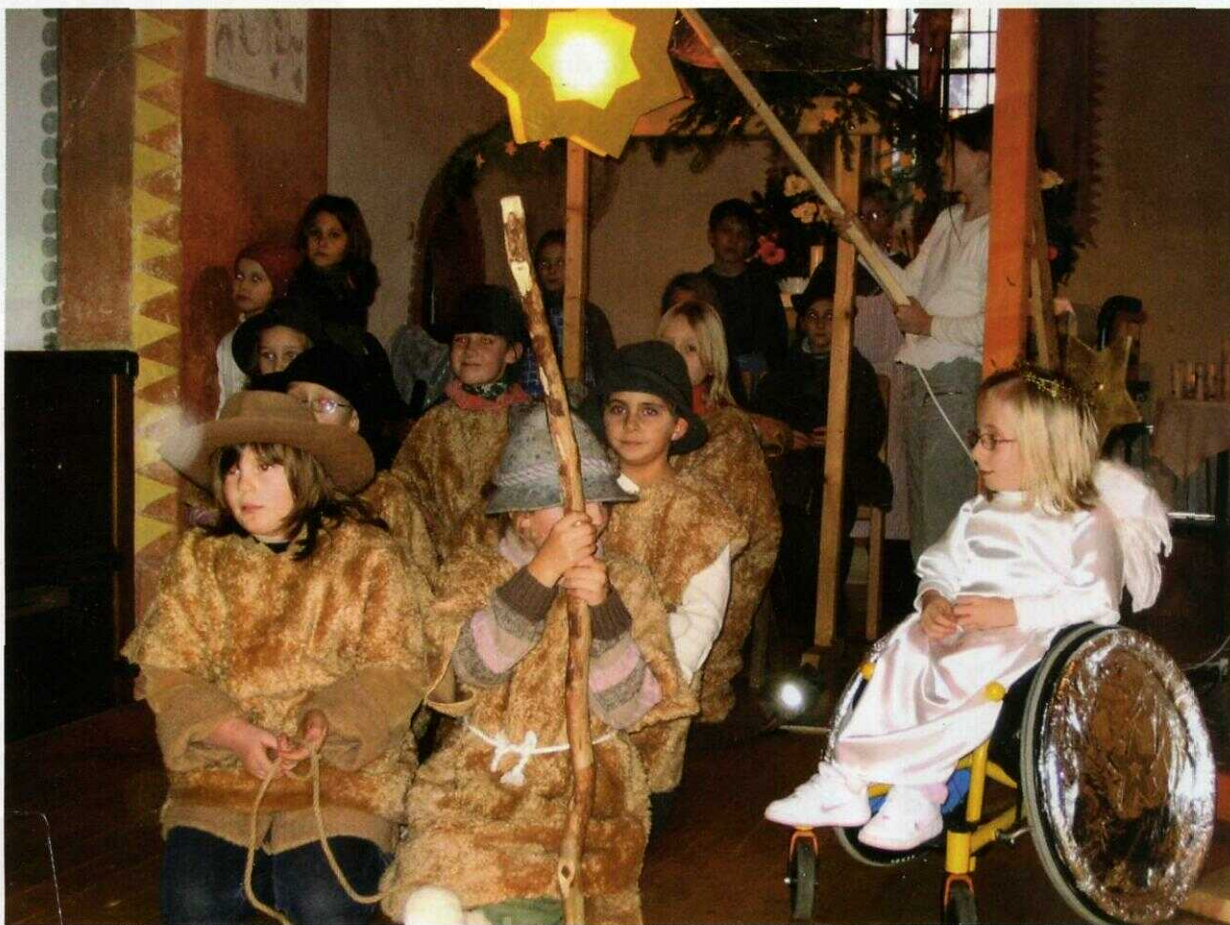
Krippenspiel Familiengottesdienst Heiliger Abend 2007

Fürchtet euch nicht! Siehe ich verkündige euch große Freude, die allem Volk widerfahren wird; denn euch ist heute der Heiland geboren, welcher ist Christus, der Herr, in der Stadt Davids.